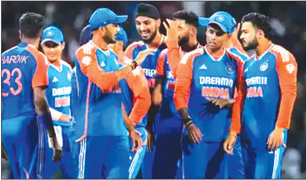
टेस्ट में भारत ने बारिश के कारण तीन दिन में ही मैच जीत लिया।

नई दिल्ली, (ईएमएस)। भारत और बांग्लादेश टीमों में 6 अक्टूबर यानी रविवार से शुरू होने वाली तीन मैचों की टी20 श्रृंखला खेलेगी। यह श्रृंखला भारत के लिए महत्वपूर्ण है, क्योंकि पिछले टी20 विश्व कप में दोनों टीमों के बीच मुकाबला हुआ था, जिसमें भारत ने बांग्लादेश को 50 रन से हराया था। अब तक, भारत और बांग्लादेश टी20 फॉर्मेट के 14 मैच खेल चुके हैं। भारत ने 13 जीते हैं, जबकि बांग्लादेश को सिर्फ एक जीत हासिल हुई है। यह एकमात्र जीत बांग्लादेश ने तीन नवंबर 2019 को दिल्ली के अरुण जेटली स्टेडियम में हासिल की थी, जब उन्होंने भारत को 7 विकेट से हराया था। इस श्रृंखला से पहले भारत और बांग्लादेश के बीच दो मैचों की टेस्ट श्रृंखला भी खेली गई, जिसमें भारत ने बांग्लादेश का 2-0 से सीरीज जीत ली है। टेस्ट में टीम इंडिया की कप्तानी रोहित शर्मा ने की और कानपुर