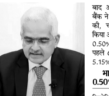
बाद अगले 10 मीटिंग्स में सेंट्रल बैंक ने 5 बार ब्याज दरों में बढ़ाव नहीं किया और एक बार अगस्त 2022 में 0.50% की कटौती की।

मुंबई: रिजर्व बैंक ऑफ इंडिया की मॉनेटरी पॉलिसी कमिटी मीटिंग 7-9 अक्टूबर को होगी। गवर्नर शक्तिकान्त दास की अध्यक्षता वाली इस मीटिंग में ब्याज दर पर फैसला लिया जाएगा। पिछली मीटिंग अगस्त को हुई थी, जिसमें कमिटी ने लगातार 9वीं बार दरों में बदलाव नहीं किया था। अक्टूबर में होने वाली मीटिंग में भी ब्याज दरों में बदलाव की उम्मीद नहीं है। मीटिंग के फैसलों की जानकारी आरबीआई गवर्नर शक्तिकान्त दास 9 अक्टूबर को देंगे। ये मीटिंग हर दो महीने में होती है। RBI ने आखिरी बार फरवरी 2023 में दरें 0.25% बढ़ाकर 6.5% की थीं।