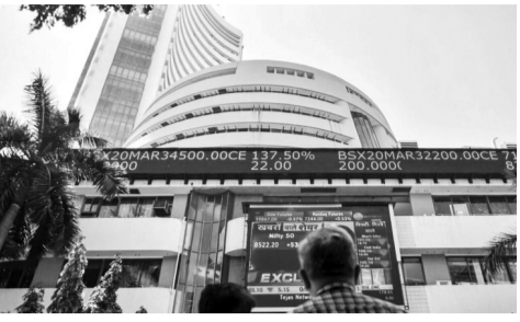
सेबी की मीटिंग में भाग लेने वाले निवेशकों की नजर तेल की कीमतों पर भी रहेगी।