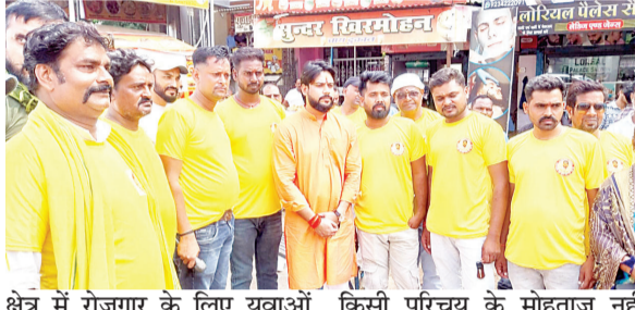
कोयलांचल संवाद संवाददाता