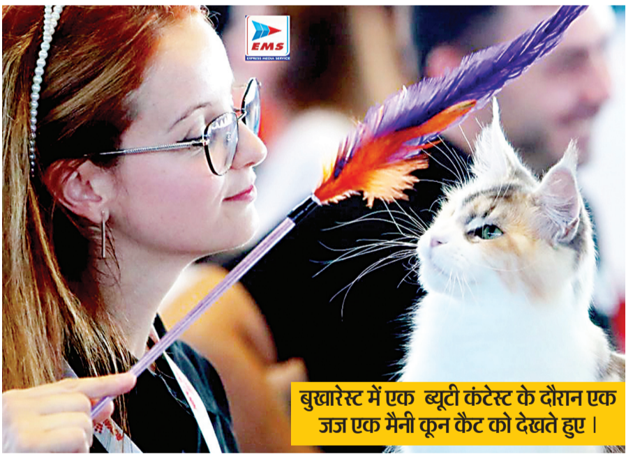
बुखारेस्ट में एक ब्यूटी कंटेस्ट के दौरान एक जज एक मैनी कून कैट को देखते हुए।