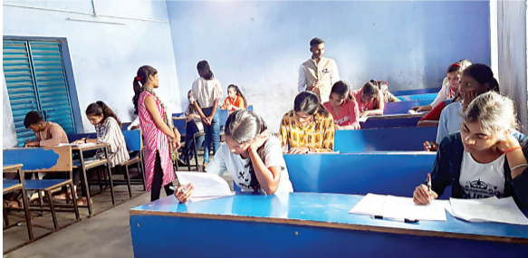
कोयलांचल संवाद संवाददाता

चतरा: चतरा के नगावां वाईपान रोड स्थित झारखंड एकेडमिक कार्डिसिल ) कक्षा 10वीं के छात्र-छात्राओं के लिए सोनु कॉन्सेप्ट एकेडमी में आयोजित गणित ओपन टेस्ट में अधिक संख्या में छात्र एवं छात्राओं ने भाग लिया। इस टेस्ट में छात्रों की संख्या ने रिकॉर्ड तोड़ दिया और एकेडमी के इतिहास में एक नया अध्याय जोड़ दिया। इस टेस्ट में उत्साह और उमंग के साथ भाग लिया और अपनी प्रतिभा का प्रदर्शन किया। सोनु कॉन्सेप्ट एकेडमी के शिक्षकों और कर्मचारियों ने इस टेस्ट के आयोजन में महत्वपूर्ण भूमिका निभाई। इस कोचिंग संस्थान के निदेशक सोनु