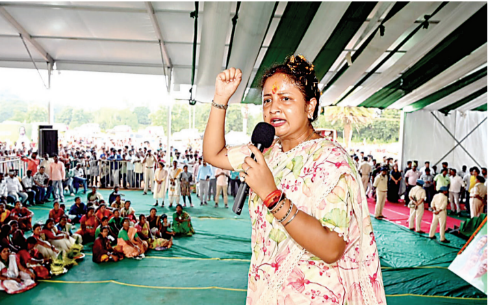
आगे बढ़ें। मुख्यमंत्री श्री हेमन्त सोरेन की यही सोच है।

कृषि मंत्री श्रीमती दीपिका पांडेय सिंह ने कहा कि अब महिलाएं कमजोर नहीं हैं। वे आत्मनिर्भर बन रही हैं। उन्होंने माननीय सांसद श्रीमती जोबा मांडी का उदाहरण देते हुए कार्यक्रम में आयीं हजारों महिलाओं से कहा कि उन्होंने अपने जीवन में बहुत सी मुश्किलों का सामना किया और आगे बढ़ी हैं। सरकार महिलाओं के साथ है। आप भी