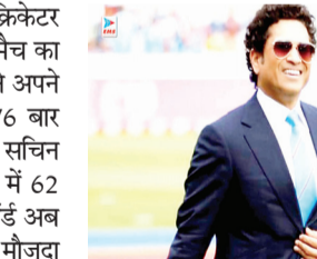
यह पुरस्कार जीता।

नई दिल्ली (इंएमएस)। महान भारतीय क्रिकेटर सचिन तेंदुलकर अब भी मैन ऑफ द मैच का खिताब पाने में सबसे आगे हैं। सचिन ने अपने अंतर्राष्ट्रीय करियर में 664 मैचों में 76 बार मैन ऑफ द मैच का खिताब जीता है। सचिन ने टेस्ट क्रिकेट में 14 बार और वनडे में 62 बार यह अवॉर्ड हासिल किया। यह रिकॉर्ड अब तक अटूट है, और उनके सबसे करीब मौजूदा भारतीय बल्लेबाज विराट कोहली हैं, जिन्होंने 534 मैचों में अब तक 67 बार मैन ऑफ द मैच का अवॉर्ड जीता है। विराट ने टेस्ट में 10, वनडे में 41 और टी20 में 16 बार यह पुरस्कार जीता है। हालांकि, विराट कोहली ने टी20 इंटरनेशनल से संन्यास ले लिया है, इसलिए अब उनके पास टेस्ट और वनडे में यह रिकॉर्ड तोड़ने का मौका है। तीसरे स्थान पर पूर्व श्रीलंकाई बल्लेबाज सनथ जयसूर्या हैं, जिन्होंने 586 मुक़ाबलों में 58 बार मैन ऑफ द मैच का खिताब जीता। उन्होंने टेस्ट में 4, वनडे में 48 और टी20 इंटरनेशनल में 6 बार