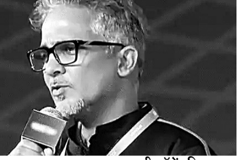
काफी कॉमेंट किए...