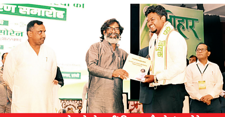
अब समय खोजने से नहीं मिलता है: हेमंत सोरेन

रांची: झारखंड में जेएसएससी की विभिन्न प्रतियोगी परीक्षा पास करने वाले 527 लोगों के बाद आज 444 प्रशिक्षण अधिकारियों को नियुक्ति पत्र सौंपा गया। झारखंड के मुख्यमंत्री हेमंत सोरेन ने शनिवार को इन 444 प्रशिक्षण अधिकारियों को नियुक्ति पत्र दिया। कार्यक्रम का आयोजन श्रम नियोजन एवं प्रशिक्षण विभाग की ओर से किया गया था। राजधानी रांची के डोरंडा स्थित जैप-1 के शौर्य सभागार में मुख्यमंत्री हेमंत सोरेन ने कुछ प्रशिक्षण अधिकारियों को अपने हाथों से नियुक्ति पत्र दिया। नियुक्ति पत्र पाकर प्रशिक्षण अधिकारियों के चेहरे खिल उठे। सरकारी नौकरी मिलने की खुशी उनके चेहरे पर साफ झलक रही थी। नवचर्यनित 444 प्रशिक्षण अधिकारियों में कृषि पदाधिकारी समेत कई पदों पर झारखंड राज्य के गठन के बाद पहली बार नियुक्ति हुई है। झारखंड के मुख्यमंत्री हेमंत सोरेन ने कहा कि उनके कार्यकाल में विभिन्न विभागों में हजारों युवाओं की नियुक्ति की गई है।