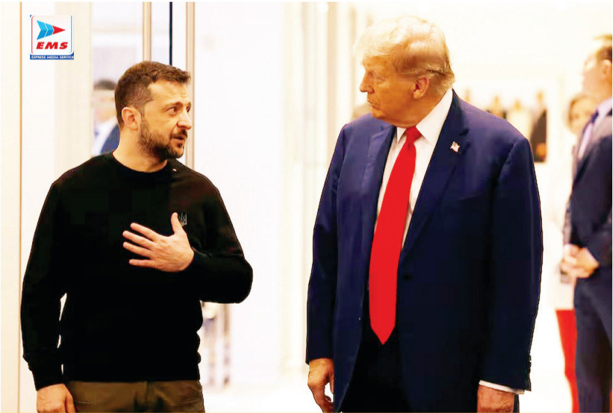
रिपब्लिकन राष्ट्रपति पद के उम्मीदवार और पूर्व अमेरिकी राष्ट्रपति डोनाल्ड ट्रम्प और यूक्रेन के राष्ट्रपति वोलोडिमिर ज़ेलेंस्की ने अमेरिका के न्यूयॉर्क शहर में ट्रम्प टॉवर में मुलाकात की।