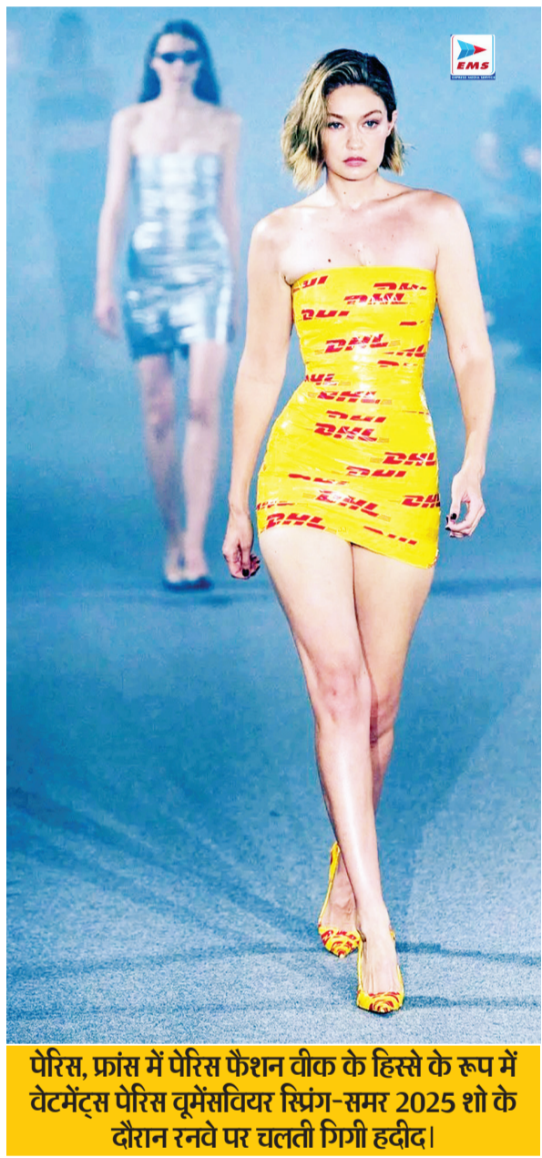
पेरिस, फ्रांस में पेरिस फैशन वीक के हिस्से के रूप में टेटमेंट्स पेरिस वूमंसवियर रिफ्रें-समर 2025 शो के दौरान रनवे पर चलती गिगी हदीद।

लंदन (ईएमएस)। ऑस्कर विजेता अभिनेत्री मैगी स्मिथ का 89 साल की उम्र में निधन हो गया। वे हेरी पॉटर फ्रेंचाइजी की फिल्म डाउनटाउन ऐबी में अपने दमदार अभिनय के लिए जानी जाती हैं। अभिनेत्री ने लंदन के अस्पताल में अंतिम सांस ली। अभिनेत्री की मौत की खबर उनके दोनों बेटों क्रिस लार्किन और टोबी स्टीफन ने साझा की। हालांकि, उनकी मौत का कारण अभी तक सामने नहीं आया है। मैगी के दो बेटों द्वारा जारी बयान में कहा गया, हम बहुत दुख के साथ डेम मैगी स्मिथ के निधन की घोषणा कर रहे हैं। 27 सितंबर की सुबह अस्पताल में उनका निधन हो गया। अंतिम समय में वे अपने दोस्तों और परिवार के साथ थीं। उनके दो बेटे और पांच प्यारी पोते-पोतियां हैं, जो अचानक अपनी मां और दादी के चले जाने से बेहद दुखी हैं। उन्होंने कहा, अस्पताल के शानदार स्टाफ ने उनके अंतिम दिनों में उनकी खूब देखभाल की। हम आपसे अनुरोध करते हैं कि इस समय हमारी निजता का सम्मान करें। मैगी ने 1952 में ऑक्सफोर्ड प्लेहाउस में एक स्टेज परफॉर्म