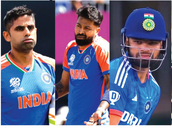
और इसके लिए बीसीसीआई जल्द ही खिलाड़ियों के नामों की घोषणा कर