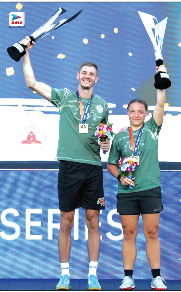
वीजिंग में टेकबाज विश्व सिरीज में जीत के बाद अर्वाड समारोह में उत्साहित खिलाड़ी अपनी ट्रॉफी दिखाते हुए।।

मुम्बई (ईएमएस)। भारत और बांग्लादेश के बीच दूसरा क्रिकेट टेस्ट मैच इसी माह 27 सितंबर से कानपुर के ग्रीन पार्क स्टेडियम में खेला जाएगा। भारतीय टीम पहले टेस्ट में जीत के साथ ही इस सीरीज में 1-0 से आगे है और उसका लक्ष्य इस मैच को भी जीतकर सीरीज 2-0 से अपने नाम करना रहेगा। कानपुर क्रिकेट स्टेडियम की पिच पहले दिन से ही स्पिनरों की सहायक मानी जाती है। यहां की विकेट सूखी और धूल भरी होती है, जिससे स्पिनरों को अधिक टर्न मिलती है। इस विकेट में उछाल बहुत कम है। ऐसे में टॉस जीतने वाली टीम पहले गेंदबाजी करना चाहेगी। भारतीय क्रिकेट ने इस स्टेडियम में अब तक 38 अंतरराष्ट्रीय मैच खेल चुकी है। इसमें टेस्ट, एकदिवसीय और टी20 सभी शामिल हैं। सभी प्रारूपों को मिलाकर भारत ने यहां 17 मैच जीते हैं जबकि 18 में उसे हार मिली है। इसके अलावा 13 मैच बराबरी पर रहे हैं। इस स्टेडियम में सबसे ज्यादा स्कोर 676/7 रहा है। ये भारतीय टीम ने ने श्रीलंका के खिलाफ टेस्ट में बनाए थे। भारत ने ग्रीन पार्क स्टेडियम में कुल 23 टेस्ट मैच खेले हैं। इसमें 7 टेस्ट में भारतीय टीम को जीत मिली है। वहीं 3 में उसे हार का सामना करना पड़ा है जबकि 13 टेस्ट ड्रॉ रहे हैं। वहीं बांग्लादेश की टीम अभी तक भारत से एक ही टेस्ट मैच नहीं जीती है। दोनों के बीच कुल 14 टेस्ट मैच खेले गए हैं। भारतीय टीम ने बांग्लादेश को 12वीं बार टेस्ट में हराया है। वहीं एक ड्रॉ रहा जबकि एक अन्य का परिणाम नहीं निकला।