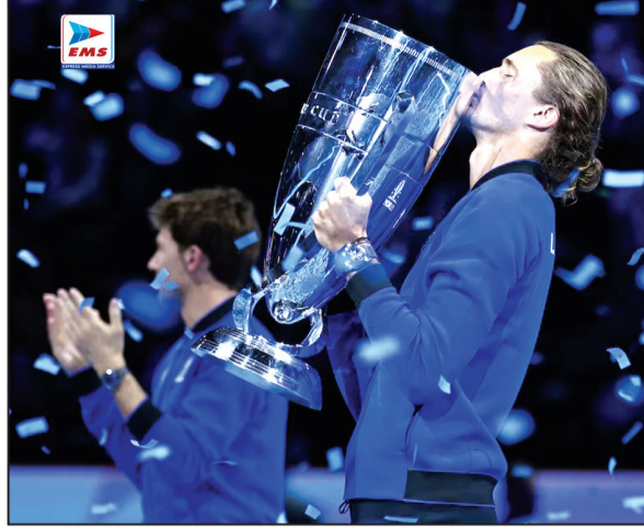
जर्मनी में लेवर कप टेनिस में जीत बाद टीम यूरोप के एलेकजेंडर ज्वेरेव ट्रॉफी के साथ खुशी जताते हुए।