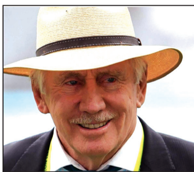
बने रहना है।" उन्होंने कहा, "ऋषभ ने भयानक कार दुर्घटना के बाद जिस तरह से टेस्ट में वापसी की है, वह शानदार है। वह भारतीय बल्लेबाजी क्रम

सिडनी (ईएमएस)। पूर्व ऑस्ट्रेलियाई क्रिकेटर इयान चैपल ने कहा कि तेज गेंदबाज जसप्रीत बुमराह और विकेटकीपर-बल्लेबाज ऋषभ पंत बॉर्डर-गावस्कर ट्रॉफी में अहम भूमिका निभा सकते हैं। चैपल के अनुसार इनके प्रदर्शन पर भारतीय टीम की जीत आधारित रहेगी। इसलिए इन दोनों का अपनी फिटनेस बनाये रखनी होगी। चैपल को लगता है कि भारतीय टीम को न्यूजीलैंड के खिलाफ मुकाबलों से भी अभ्यास का अच्छा अवसर मिलेगा। चैपल ने कहा, "भारत की प्राथमिकता यही होगी कि उसके ज्यादातर खिलाड़ी फॉर्म में रहें और उन्हें कोई बड़ी चोट नहीं लगे। हालांकि सबसे ज्यादा जरूरी बात बुमराह और ऋषभ का फॉर्म में रहना और फिट