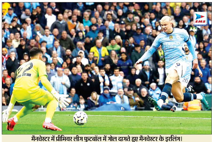
मैनचेस्टर में प्रीमियर लीग फुटबॉल में गोल दागते हुए मैनचेस्टर के इरलिंग।

चेन्नई (ईएमएस)। भारतीय टीम के अनुभवी स्पिनर आर अश्विन ने बांग्लादेश के खिलाफ हुए पहले टेस्ट मैच में शानदार गेंदबाजी के साथ ही दिग्गज ऑस्ट्रेलियाई स्पिनर शेन वार्न के एक रिकार्ड की भी बराबरी कर ली है। अश्विन ने इस मैच में शतक लगाने के साथ ही दूसरी पारी में छह विकेट लिए थे। इसी के साथ ही उन्होंने 37वीं बार पांच से अधिक विकेट लेने के वार्न के रिकार्ड की भी बराबरी कर ली है। अश्विन अब सबसे अधिक उम्र में पांच विकेट लेने वाले एकमात्र भारतीय खिलाड़ी गए हैं। इससे पहले पारी में शतक के साथ ही पांच विकेट लेने वाले खिलाड़ियों में पूर्व दिग्गज इयान बॉथम, मेरी सोबर्स, मुस्ताक मोहम्मद, जैक्स कैलिस के अलावा वर्तमान में खेल रहे शाकिब अल हसन, रवींद्र जाडेजा हैं।