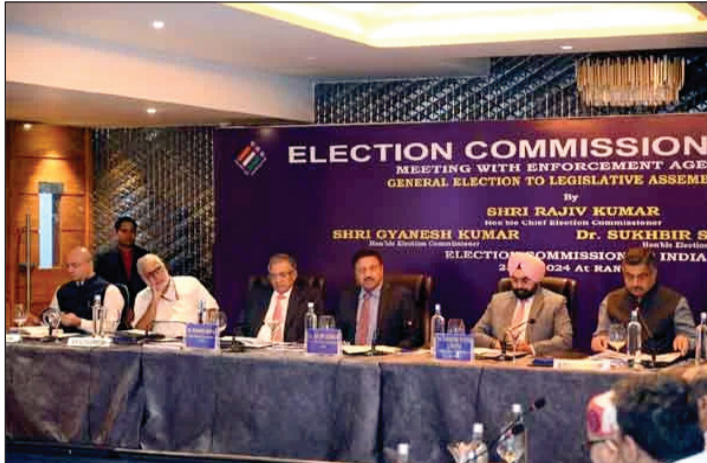
बेहतर मतदान प्रतिशत के लक्ष्य को हासिल करने की दिशा में सभी राजनीतिक दलों से सहयोग की अपील की।

आयोग ने सर्वप्रथम झारखंड अंतर्गत राष्ट्रीय एवं राज्य स्तरीय मान्यता प्राप्त दलों के प्रतिनिधियों के साथ विधानसभा चुनाव के परिप्रेक्ष्य में बैठक की। इस दौरान मुख्य निर्वाचन आयुक्त ने आगामी विधानसभा चुनाव को निष्पक्ष तरीके से संपन्न कराने तथा